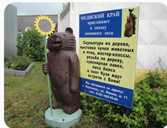
• Эко- парк отдыха «Медвежий край»