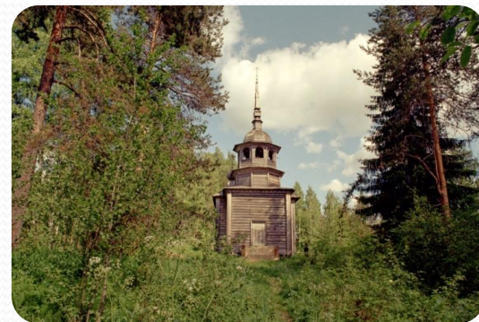
• Кенозерский национальный парк