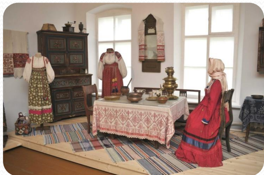
• Каргопольский музей