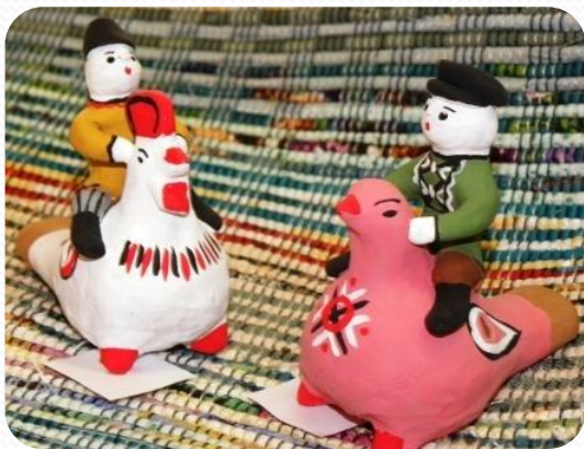
• Центр народных ремесел «Берегиня»