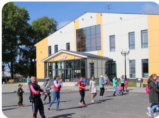
• Каргопольский ЦКР