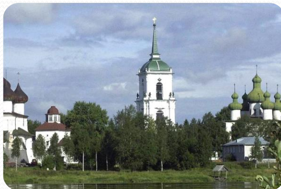
• Памятники архитектуры